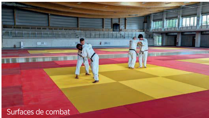
Surfaces de combat

Après un peu plus d'un an de travaux, le DOJO du complexe sportif Marie-Curie offre plusieurs espaces sur une surface de 2 740 m 2 . Suivez le guide !