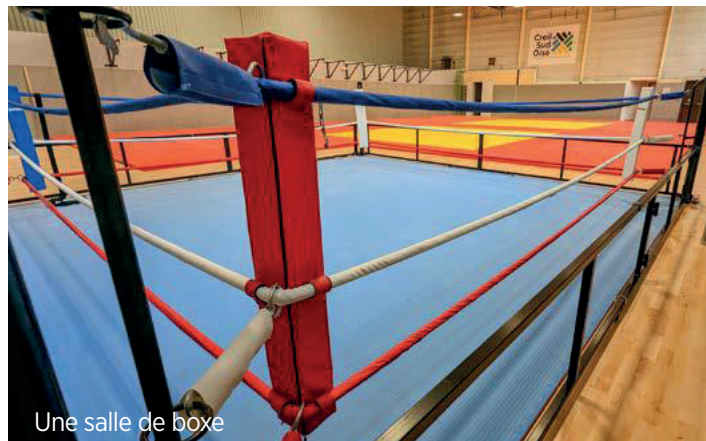
Une salle de boxe