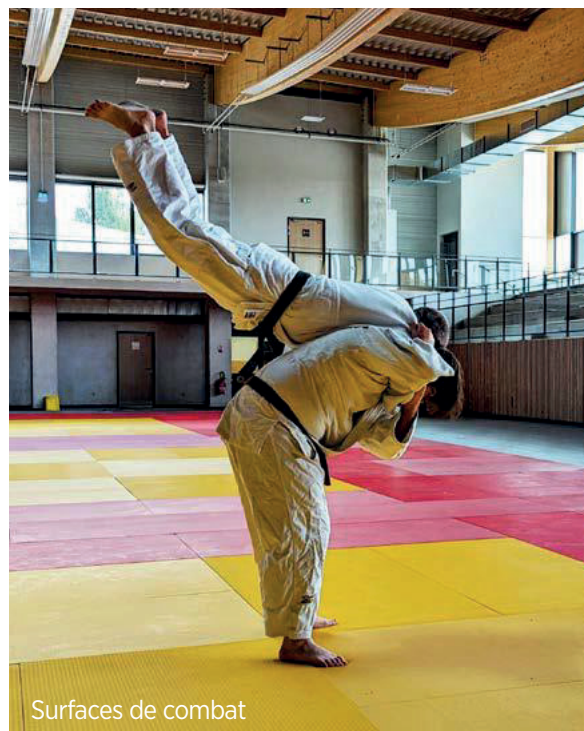
Surfaces de combat