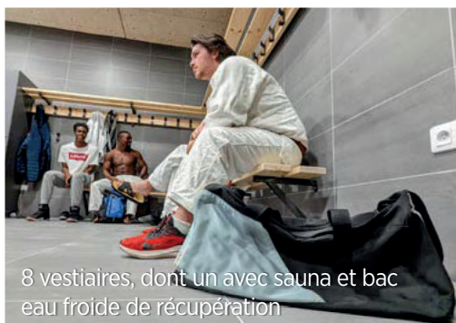
8 vestiaires, dont un avec sauna et bac eau froide de récupération

L'objectif est de pratiquer les arts martiaux et les sports de combat dans des espaces conçus à la fois pour l'entraînement et la compétition.