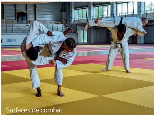
Surfaces de combat