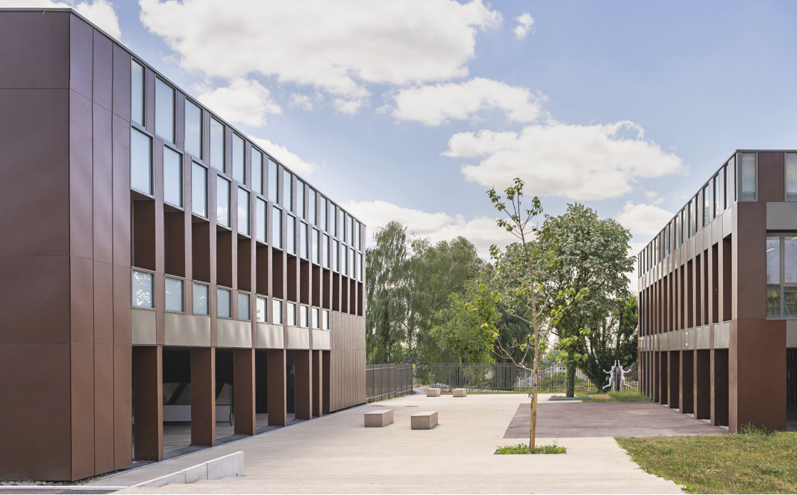
Vers la Vallée de la Bievre