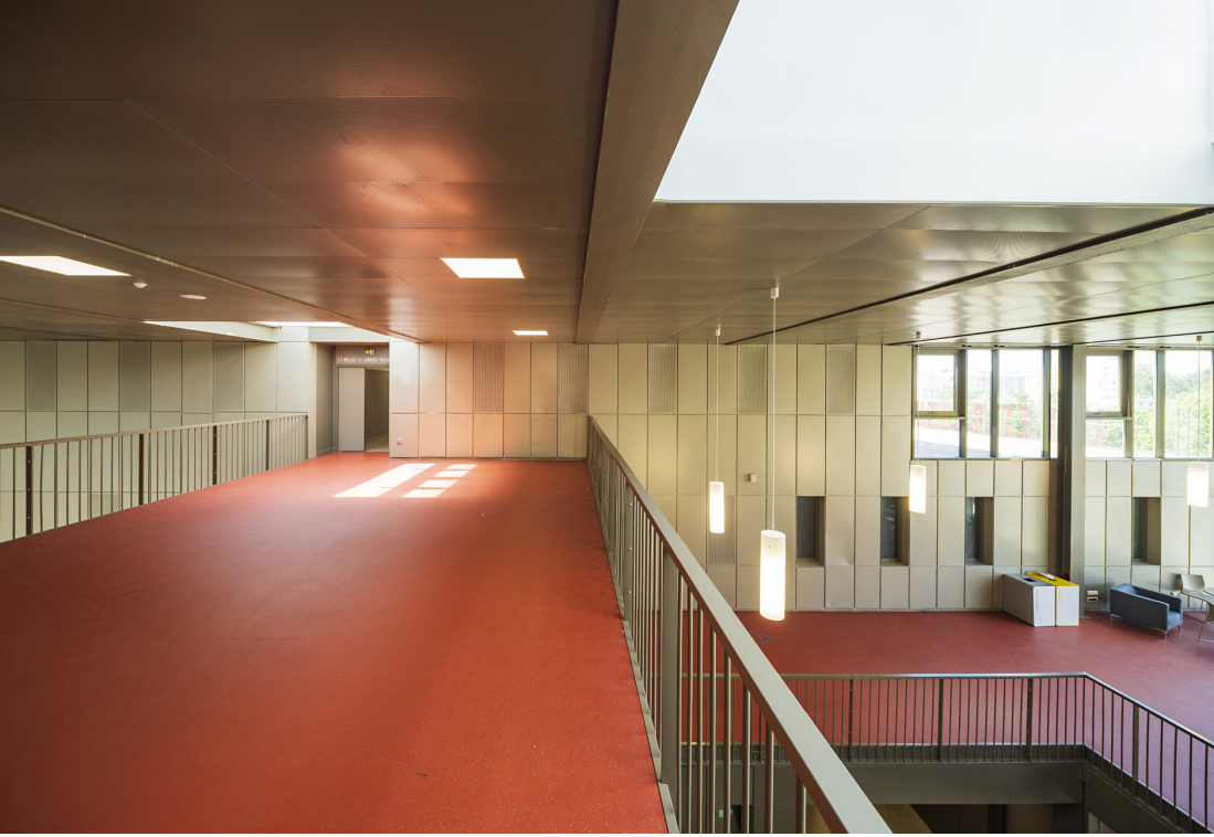
Le grand hall, espace de convivialité