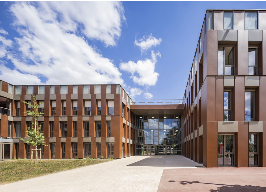
Vers le grand hall