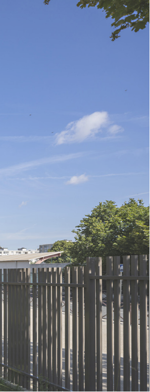
Rue du Professeur Bergonié