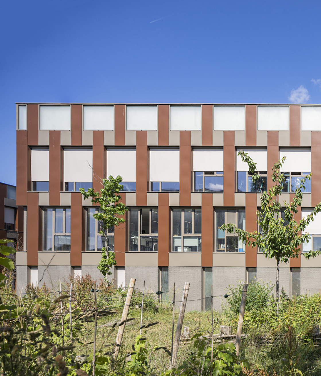
Les jardins pédagogiques, lieu d'expérimentation