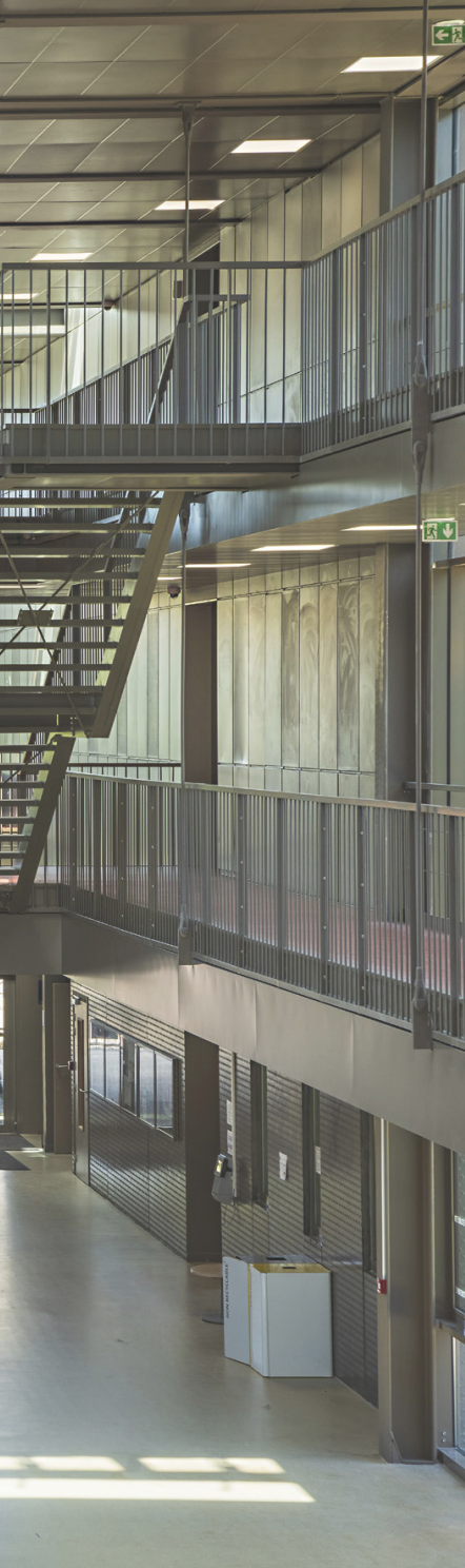
Le grand hall - côté entrée