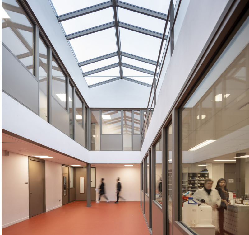
Le centre des plots creusé pour apporter de la lumière naturelle